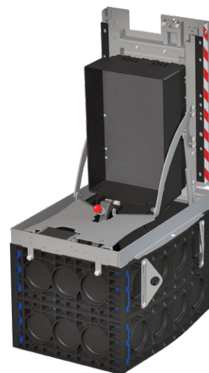
▲ EK510 Connect